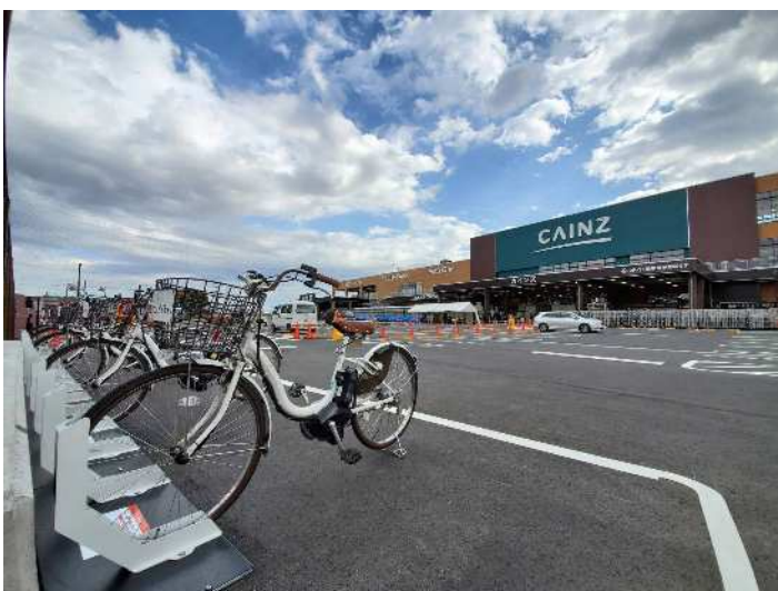
「くみまちモールあさか」(埼玉県朝霞市根岸台3丁目20番1号)