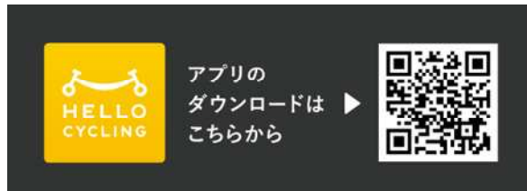
専用アプリQRコード