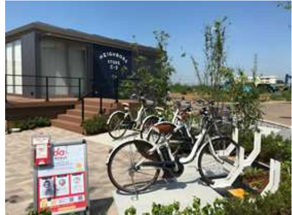
ステーションイメージ